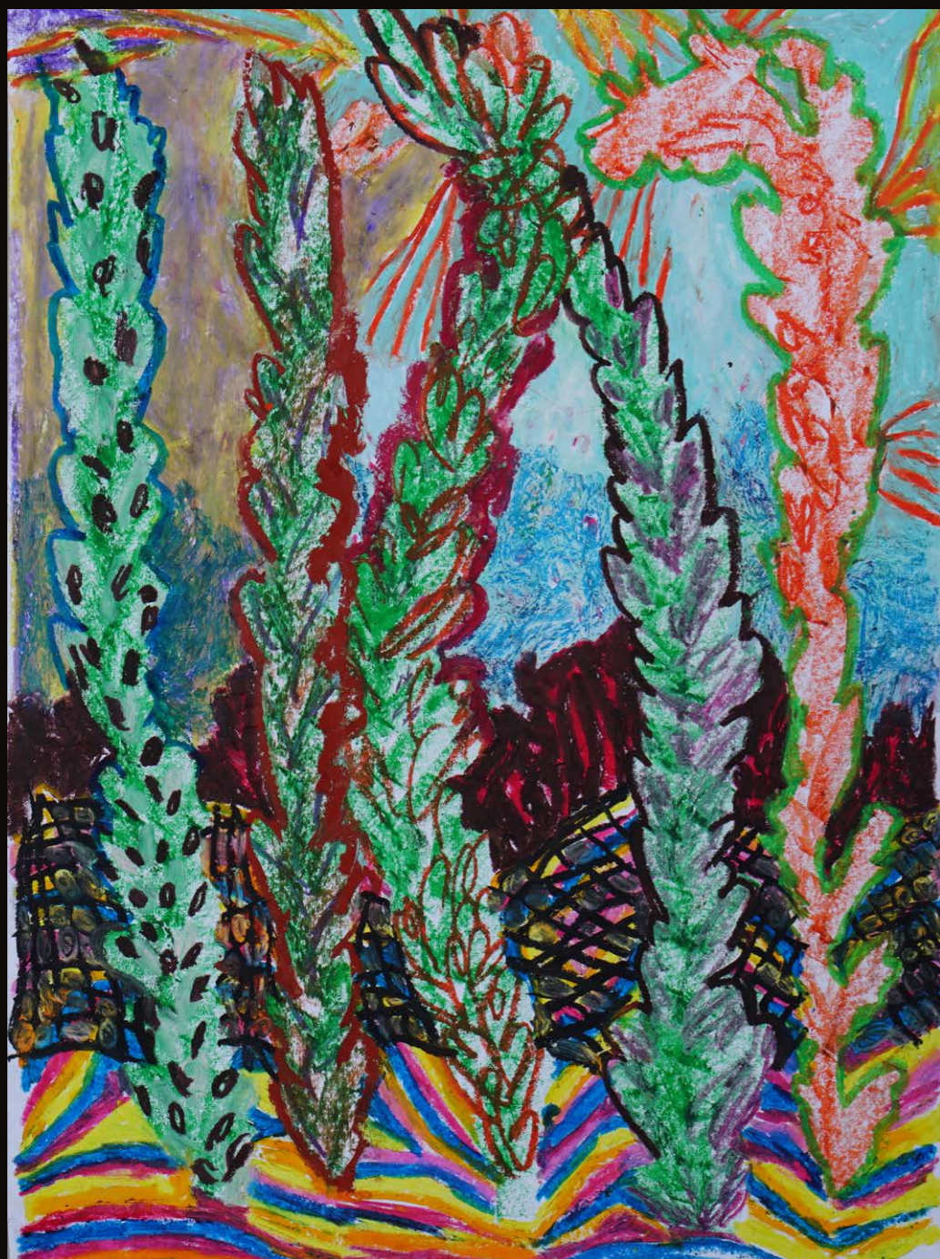
Nadia Drubich Helecho, de la serie Una corriente Óleo pastel sobre papel 35 cm x 50 cm