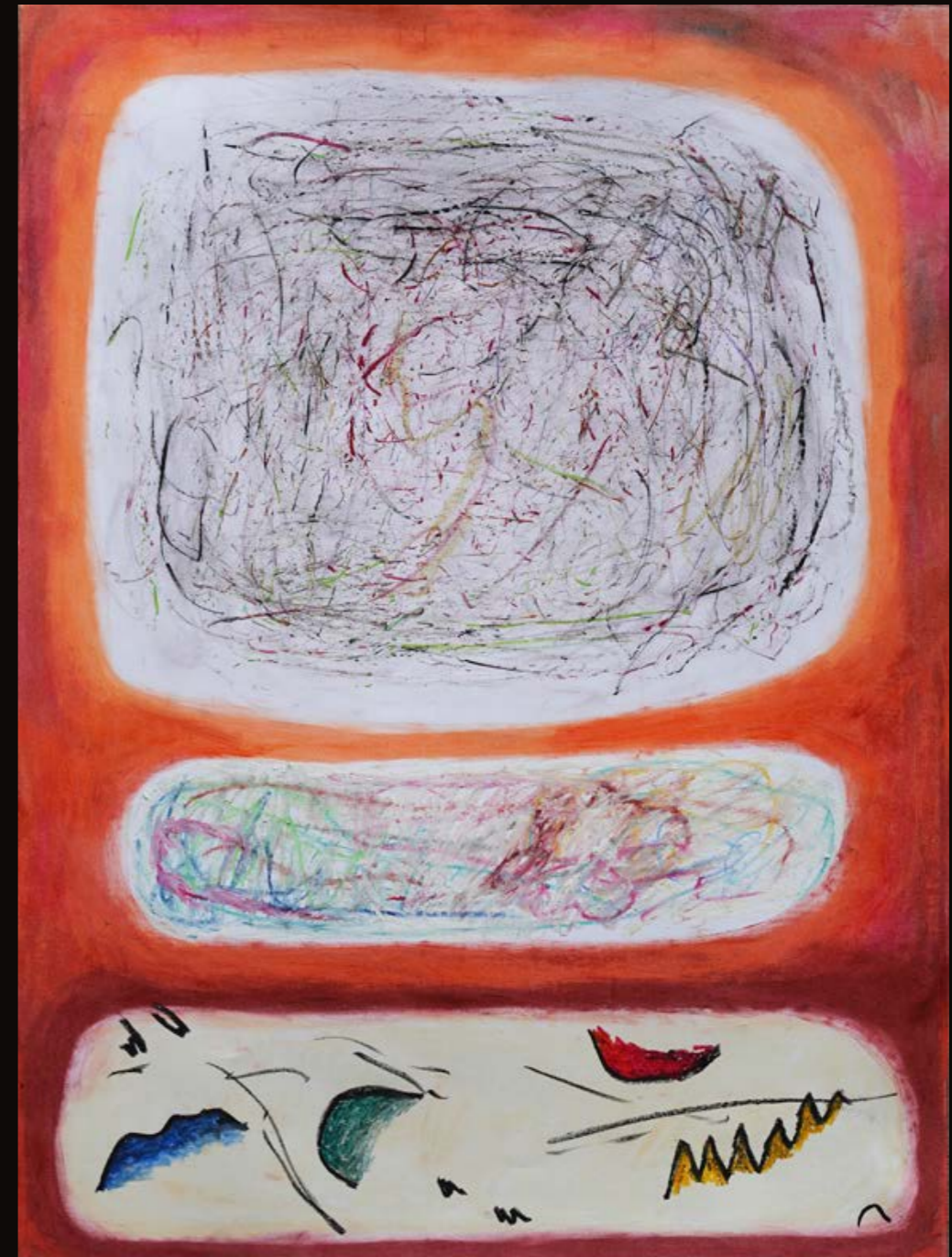
Nadia Drubich Tivi, de la serie Encuentro permanente y cotidiano. Óleo pastel sobre papel 50 cm x 75 cm (sin marco)