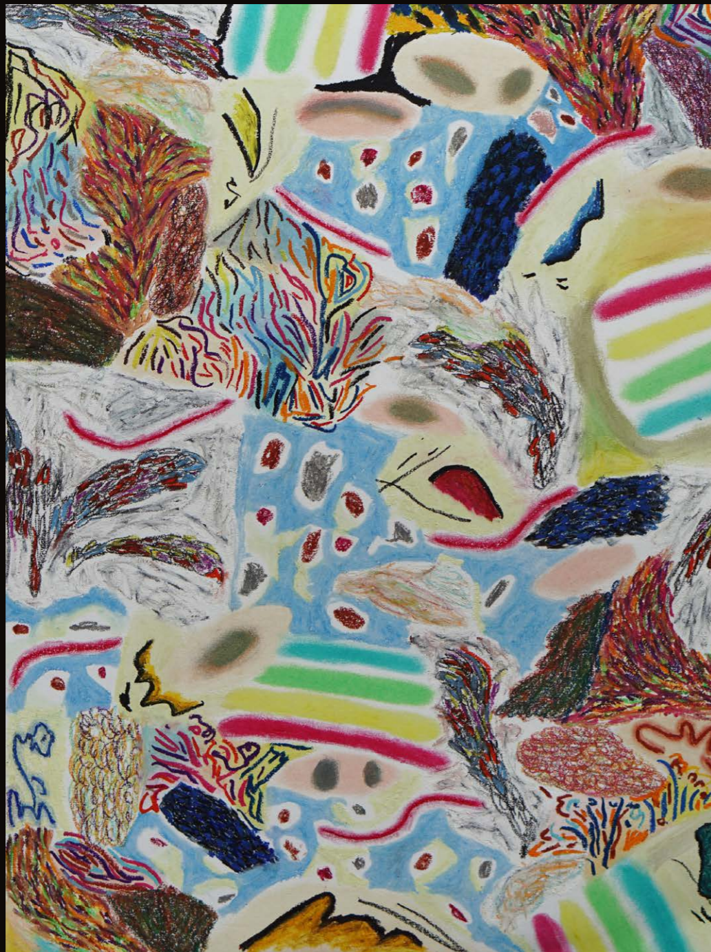
Nadia Drubich Confusión, de la serie Encuentro permanente y cotidiano Óleo pastel sobre papel 75 cm x 50 cm